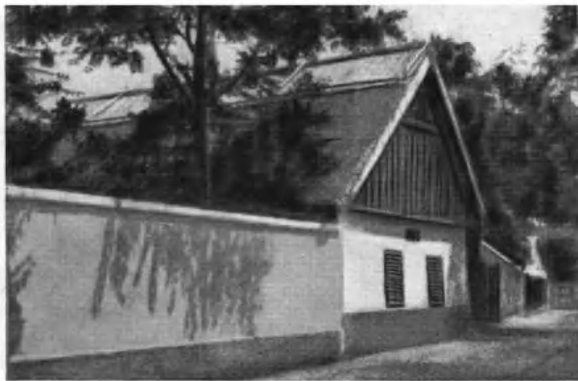
Дом, где родился Петефи, сегодня.