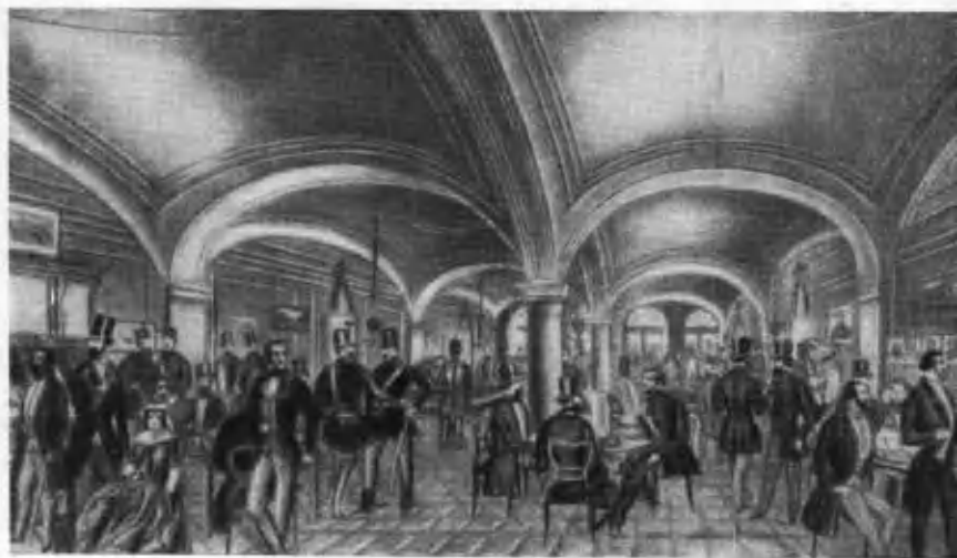
Кофейня «Пильвакс» (Клуб революционеров в 1848 году).