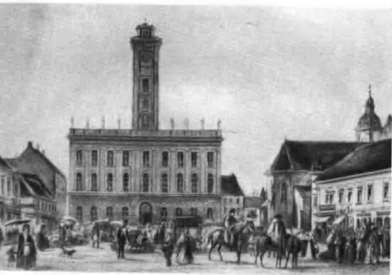
Ратуша в Пеште в 1848 году.

Молодежь празднует сто лет венгерской революции 1848 года.