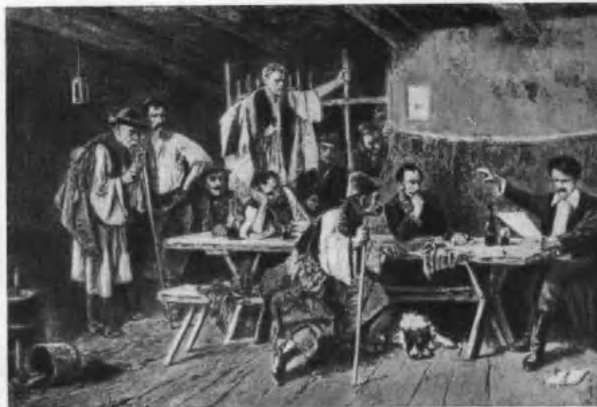
Петефи читает свое стихотворение крестьянам.