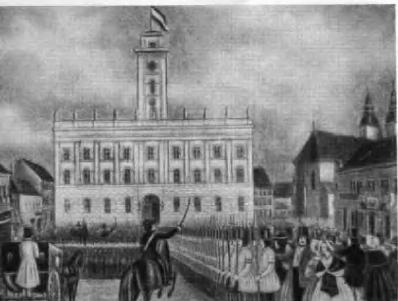
Присяга венгерских революционных войск у ратуши в Пеште в 1848 году.