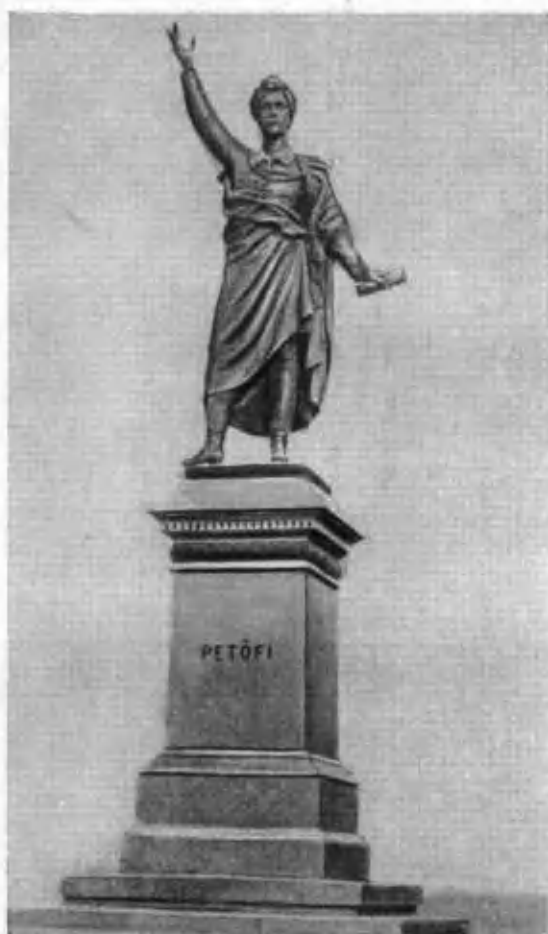
Памятник Петефи в Будапеште.