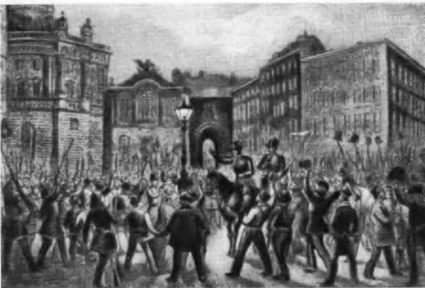
Революция в Вене 13 марта 1848 года.