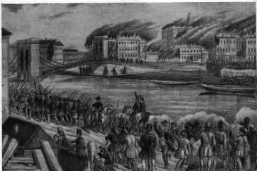
Осада Буды революционными венгерскими войсками.